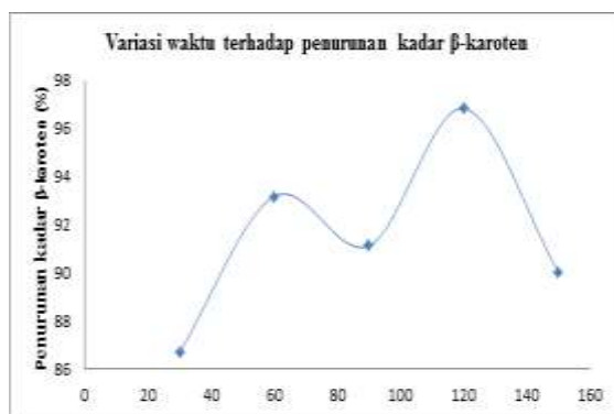
Gambar 5 Grafik hubungan variasi waktu interaksi terhadap penurunan kadar \beta -karoten

Grafik penurunan \beta -karoten dilihat pada gambar 5. Dari hasil perhitungan nilai FCI diperoleh waktu interaksi optimum adalah 120 menit dengan kadar penurunan \beta -karoten sebesar 96,826%.