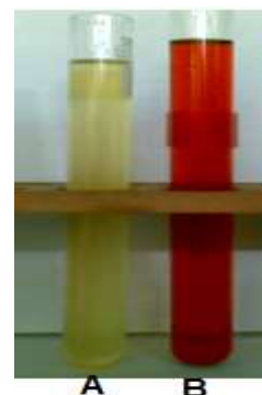
Gambar 1 Warna CPO setelah interaksi (A) dan sebelum interaksi (B) dengan Adsorben

Kajian rasio dilakukan dengan menginteraksikan Ca-Al-Hidrotalsit dengan berbagai berat yakni 1,8; 1,4; 1; 0,6 dan 0,2 g masing-masing dengan 20 g CPO. Interaksi dilakukan selama dua jam pada pemanasan 70 0 C.