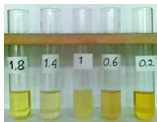
Gambar 2 CPO yang telah mengalami pemucatan oleh Ca-Al-Hidrotalsit dengan variasi jumlah adsorben

Pengamatan terhadap variasi jumlah Ca-Al-Hidrotalsit, secara visual dapat dilihat pada gambar 2, adsorpsi optimum \beta -karoten oleh Ca-Al-hidrotalsit terjadi pada rasio adsorben dan substrat 7% (1,4 : 20), dimana warna minyak yang dihasilkan paling bening, setelah itu 5%; 9%; 3%, dan 1%.