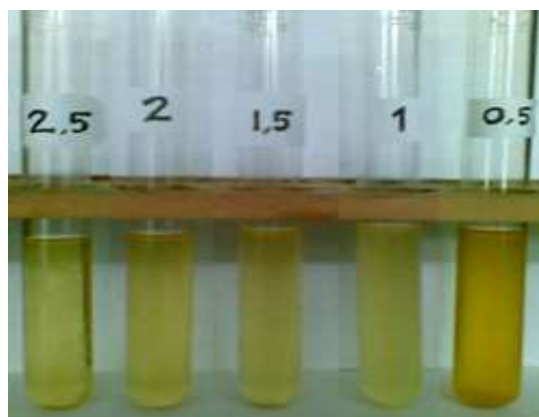
Gambar 4 CPO setelah pemucatan oleh Ca-Al-Hidrotalsit dengan variasi waktu

Hasil interaksi CPO dengan Ca-Al-Hidrotalsit, secara fisik dapat dilihat bahwa pada menit ke-30 telah terjadi adsorpsi \beta -karoten oleh Ca-Al-Hidrotalsit. Adsorpsi pada menit ke 60 hingga 150, adsorpsi \beta -karoten terlihat lebih tinggi, CPO lebih jernih.