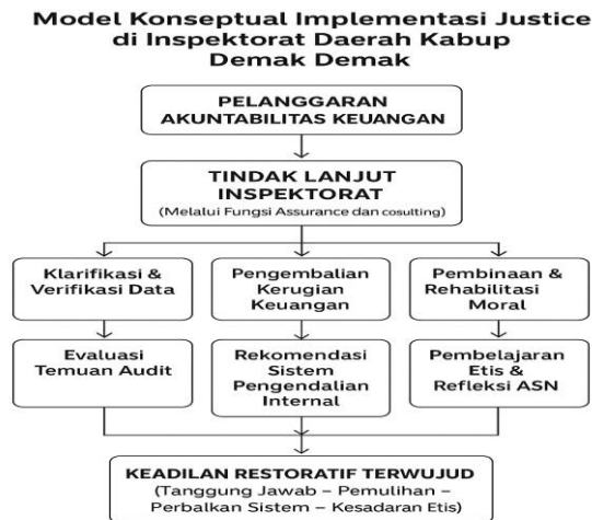
Gambar 1. 2 Model Konseptual

Gambar di atas menggambarkan bahwa penerapan Restorative Justice di Inspektorat Daerah Kabupaten Demak diawali dari temuan pelanggaran akuntabilitas keuangan yang bersifat administratif. Proses penyelesaian tidak langsung diarahkan ke penegakan hukum, melainkan melalui mekanisme tindak lanjut internal berbasis pembinaan. Tahapan pertama adalah klarifikasi dan verifikasi data oleh auditor dan pejabat pengawas untuk memastikan keakuratan temuan serta mengidentifikasi sumber permasalahan.