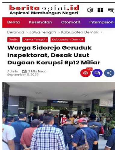
Gambar 1. 1 Korupsi Dana Desa Sidorejo

Kasus dugaan korupsi dana desa Sidorejo senilai Rp12 miliar yang melibatkan Kepala Desa dan dilaporkan ke Inspektorat Kabupaten Demak pada tahun 2025 memicu protes warga yang menuntut tindakan segera dan transparansi. Peristiwa ini menunjukkan betapa sulitnya memastikan pengawasan internal berjalan efektif serta lemahnya sistem peringatan dini untuk mendeteksi pelanggaran penggunaan keuangan publik (Admin, 2025). Korupsi merupakan bahaya laten yang dapat menghancurkan sendi-sendi kehidupan berbangsa dan bernegara.