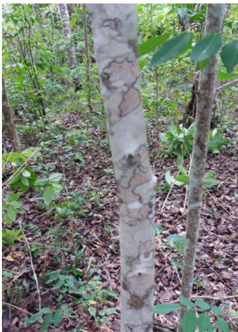
Gambar 1. Pohon kayu ular ( S. lucida ).

sehingga total darah yang dibutuhkan adalah 60 mL. Relawan yang diambil darahnya berumur 21–27 tahun, dengan keadaan fisik yang sehat dan tidak memiliki riwayat penyakit pendarahan.