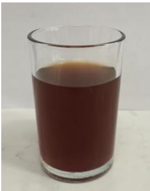
Gambar 1. Warna air seduhan teh cascara Kukopa.