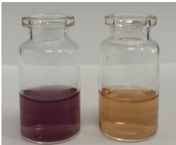
Gambar 2. Perubahan warna larutan DPPH.

diperoleh tersebut lebih tinggi dibandingkan dengan standar yang ditetapkan SNI 3753:2014, yaitu maksimal 10%.