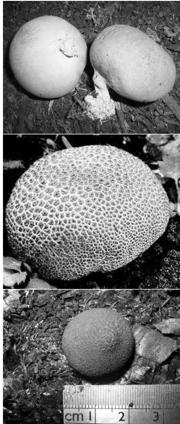
Gambar 2. Keragaman Fungi Ektomikoriza. A. Scleroderma sinamariense ., B. S. citrinum ., dan C. Geastrum sp.

Barat), diketahui terdapat 18 strain ektomikoriza yang diperkirakan masuk dalam 9 jenis, namun baru 4 jenis yang sudah teridentifikasi., yakni: Scleroderma sinamariense , S. flavidum , S. citrinum , S. flavidum dan Geastrum sp.(Gambar 2).