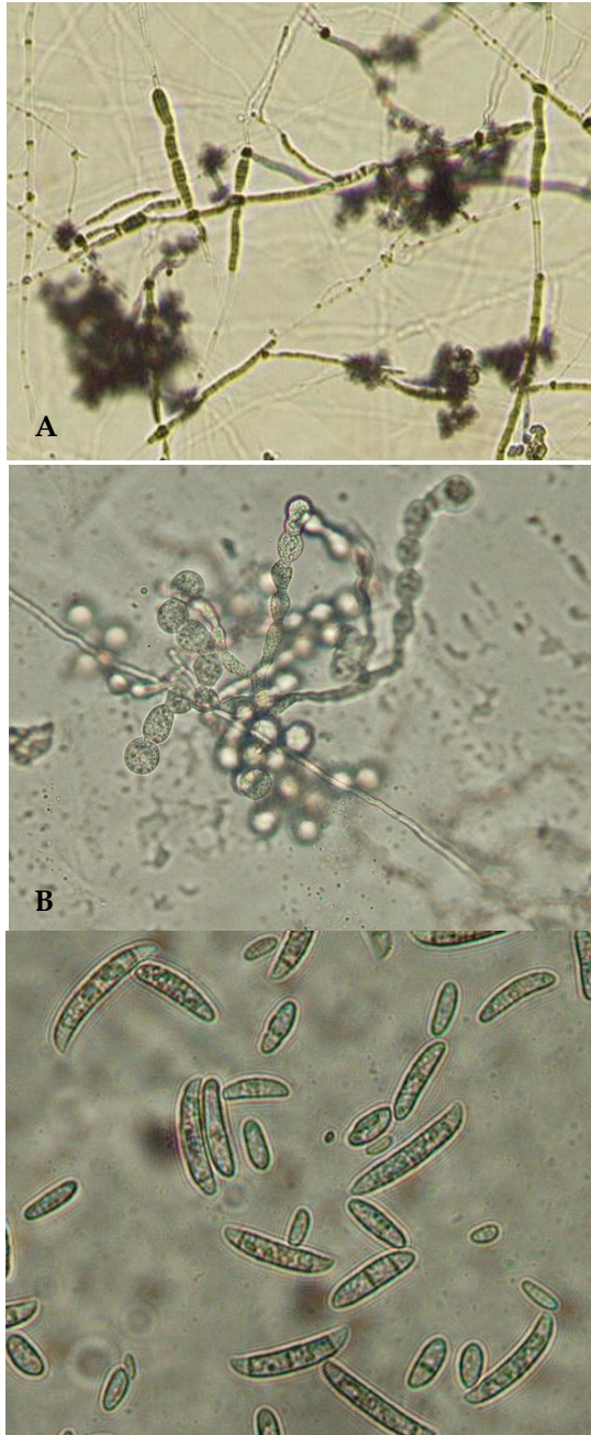
Gambar 2. Beberapa jenis fungi mikoriza anggrek. A. Rizochoetia sp., B. Ceratorhiza sp., dan C. Tulasnella sp.

Hingga kini usaha untuk budidaya berbagai macam jenis pertanian di wilayah Papua khususnya, pertumbuhan bidang pertanian terhambat oleh pasokan pupuk yang sangat terbatas. Di lain pihak, pemanfaatan pupuk hayati yang dikembangkan dari berbagai jenis fungi