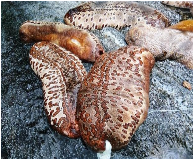
Gambar 1. Teripang Kridou Bintik ( B. argus ) asal Pantai Harlem, Jayapura, Papua.