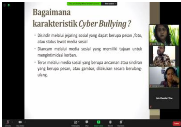
Gambar 2. Foto pada saat pemberian materi di lingkungan pemuda dan remaja di RT.005 RW.007 Kelurahan Kota Baru Distrik Abepura

Ada tiga pokok materi penyuluhan yang diberikan kepada peserta Kegiatan di SMA Negeri 3 Jayapura dan Lingkungan Pemuda dan RFemaja RT 007 dan RW 005 Kelurahan Kota Baru Distrik Abepura yaitu :