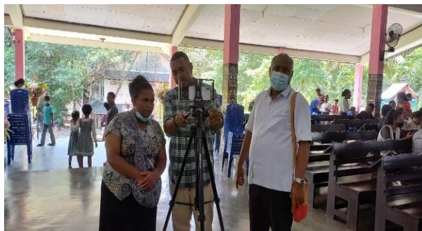
Gambar 3. Simulasi Presentasi Untuk Promosi Barang Secara Online

Dokumentasi pelaksanaan kegiatan pengabdian kepada PAM GKI I.S Kijne Abepura dilakukan di ruang gereja seperti diperlihatkan