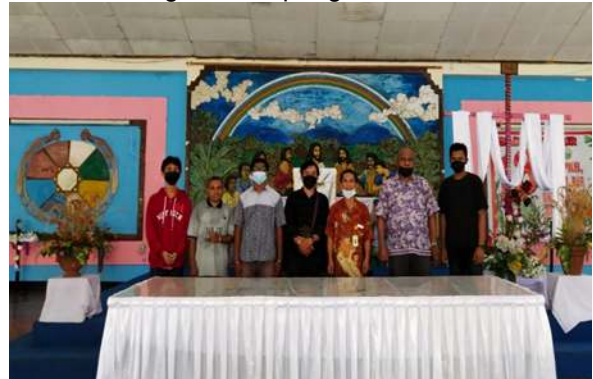
Gambar 4. Foto Bersama Dengan Mitra Pengabdian

pada gambar 3. Gambar 4 memperlihatkan foto bersama dengan mitra pengabdian.