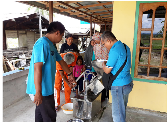
Gambar 5. Demonstrasi pengoperasian mesin ekstraktor sari buah jeruk

Kelebihan mesin ekstraktor buah jeruk ini adalah design yang sederhana dan praktis dalam penggunaan. Kekurangan yang harus diperbaiki adalah kesetimbangan kecepatan pemotongan dan pemerasan serta kecepatan turunnya buah jeruk yang telah terpotong. Beberapa bagian masih perlu diperbaiki agar target kecepatan pemotongan 25 kg buah jeruk per-jam dapat tercapai.