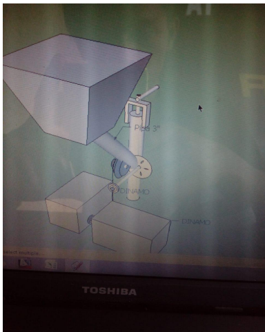
Gambar 1. Skema mesin ekstraktor buah jeruk secara garis besar