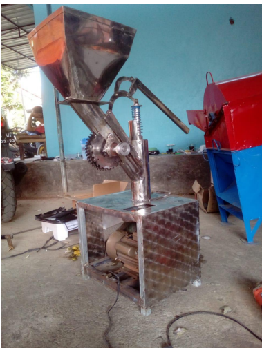
Gambar 3. Gambar mesin ekstraktor buah jeruk

Kelebihan mesin ekstraktor buah jeruk ini adalah design yang sederhana dan praktis dalam penggunaan. Kekurangan yang harus diperbaiki adalah kesetimbangan kecepatan pemotongan dan pemerasan serta kecepatan turunnya buah jeruk yang telah terpotong. Beberapa bagian masih perlu diperbaiki agar target kecepatan pemotongan 25 kg buah jeruk per-jam dapat tercapai.