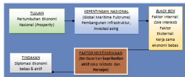
Gambar 2. Rational Actor Model-Foreign Policy Decision-Making Process .

Sebagai pemain aktif, Indonesia harus leluasa dalam menjalin kerja sama dengan negara mana pun di dunia. Oleh karena itu, Indonesia harus menentukan alat kebijakan luar negeri yang dianggap sesuai dengan prinsip aktif tersebut. Diplomasi ekonomi adalah jawabannya. Sudah sejak awal masa pemerintahan Joko Widodo diplomasi ekonomi menjadi salah satu pilar utama yang sangat diperkuat perannya. Penulis mengidentifikasi hal tersebut dengan menggunakan Rational Actor Model-Foreign Policy Decision Making Process , seperti gambar di bawah ini.